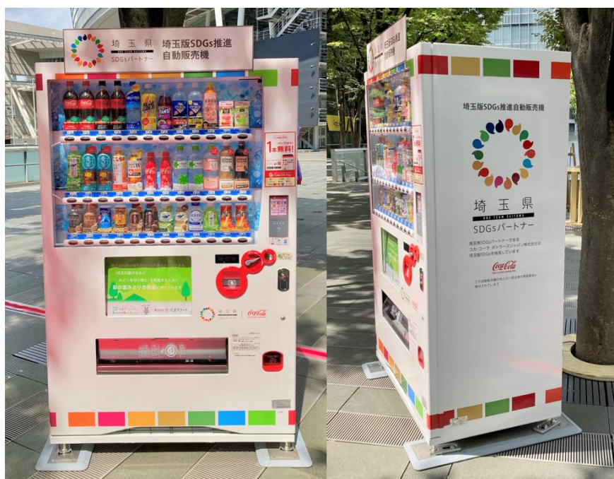
「埼玉版 SDGs 推進自動販売機」1号機