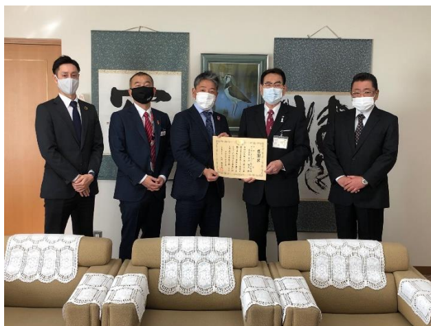
(左) 3月2日、清瀬市との寄贈式時の様子、(右) 3月3日、北区との寄贈式時の様子