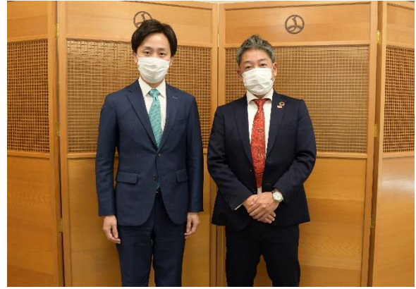
3月1日、千代田区との合同記者会見時の様子