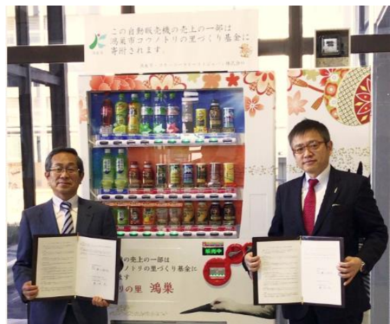
設置先:鴻巣市役所本庁舎1階ロビー 自動販売機前